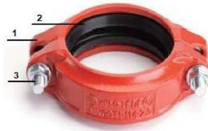
Рис.2. Гибкая муфта «LEDE».